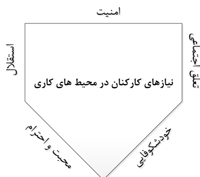
شکل ۱- مدل مفهومی پژوهش (نیازهای پنجگانه کارکنان در محیط های کاری)