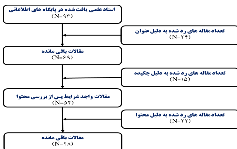
شکل ۱- جست و جو و انتخاب مقالات مناسب